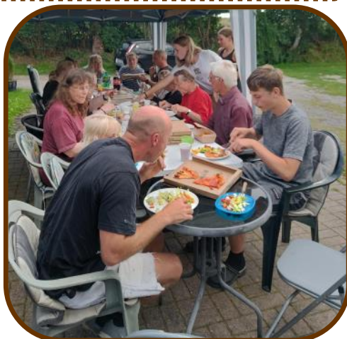
Så er der pizza.