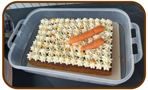
Dittes lækre gulerodskage

Malia syntes også, at det var rigtig spændende at blive kaldt op sammen med alle de andre deltagere og få sin første roset og sit pointkort.