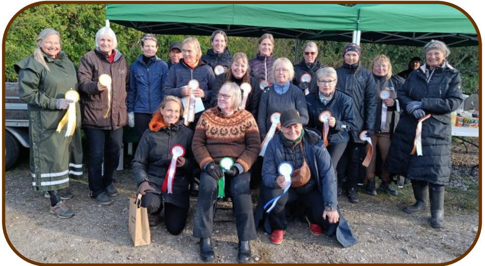
Senior klassen (over 50 år)