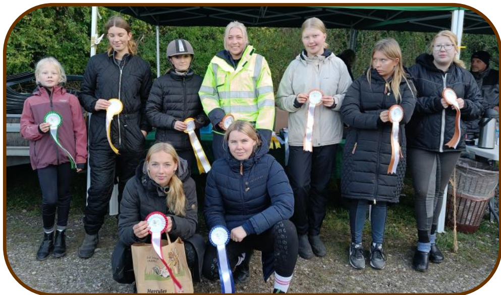
Junior klassen (under 25 år)