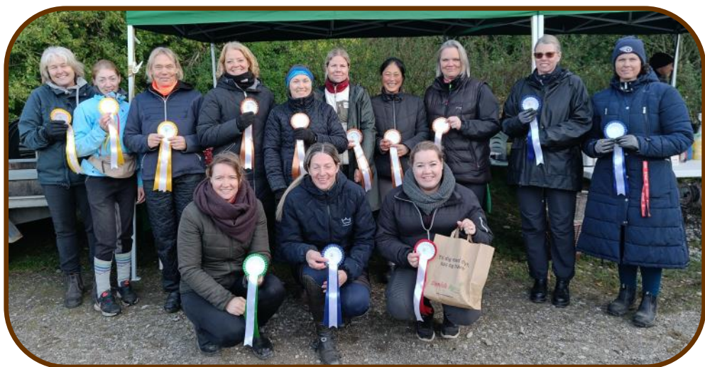
Mellem klassen (25 - 49 år)