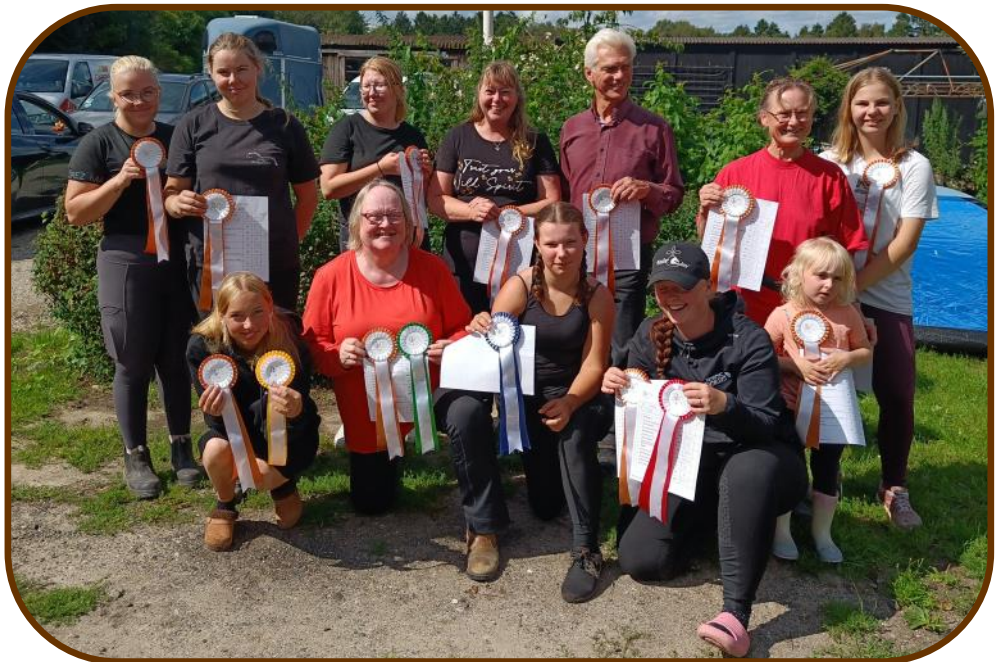
Glade deltagere.

Malia syntes også, at det var rigtig spændende at blive kaldt op sammen med alle de andre deltagere og få sin første roset og sit pointkort.