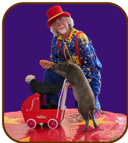
Cirkusgrisen kører "taxa" med hønen

Cirkus Bella-Donna regner med, at der kommer en del tilskuere til cirkus udefra, og de tilpasser størrelsen af teltet til det antal tilskuere, de forventer. De har større telte end det, der var oppe sidste år.