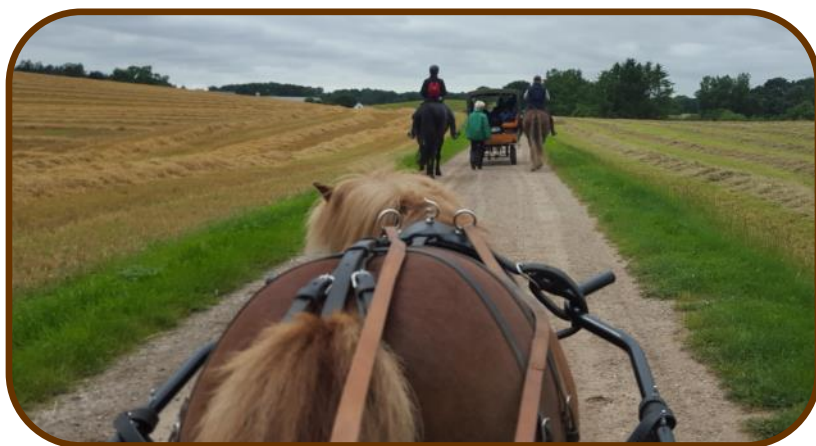
Flot udsigt over marker og hesteryg.

Mandag kørte vi 18 km. Til Tadre Mølle, hvor vi skulle overnatte. Vi kørte lidt hurtigere tempo den dag, da det var vigtigt at nå frem, så vi kunne nå at købe kaffe og kage inden cafeen lukkede. Vores medbragte mad blev spist i hestevogn og på hesteryg i farten.