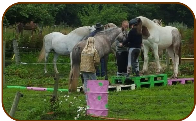
Agility på Hyggeweekend.

Agility blev gennemført mellem små bygerne, men det lod vi os ikke påvirke af. Alt foregik i god ro og orden og stemningen var i top som altid.