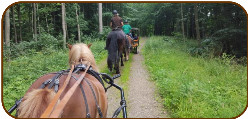
En flot rute på turen.

Den første dag havde de andre kørt/redet 17 km. Og i dag ventede 22 km. Vi skulle til Ordruplund og overnatte. Vi kørte både gennem byen og gennem en pragtfuld skov. Lige gyldigt hvor vi kom frem, blev der vinket og mange spurgte om hvor vi kom fra og hvor vi skulle hen. Naturen blev nydt rigtig meget, da jeg ikke er så heldig at have skov, der hvor jeg bor. Vi ankom til Ordruplund henad eftermiddagen og her satte vi folde op til hestene.