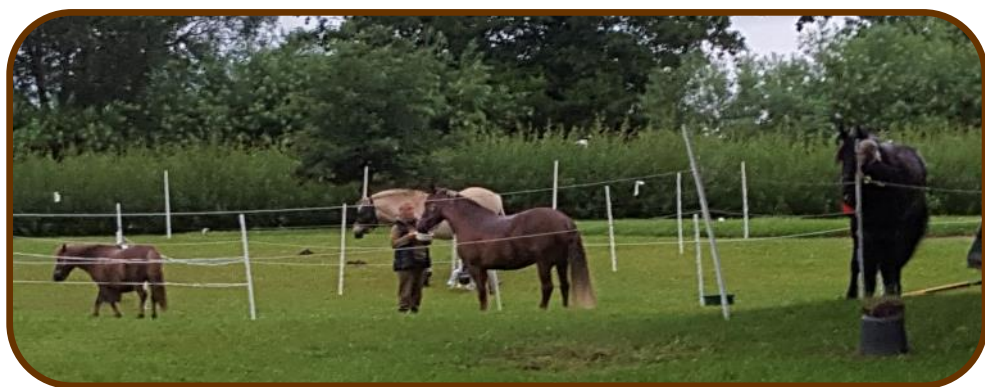
Der aftenfodres.

Den første dag havde de andre kørt/redet 17 km. Og i dag ventede 22 km. Vi skulle til Ordruplund og overnatte. Vi kørte både gennem byen og gennem en pragtfuld skov. Lige gyldigt hvor vi kom frem, blev der vinket og mange spurgte om hvor vi kom fra og hvor vi skulle hen. Naturen blev nydt rigtig meget, da jeg ikke er så heldig at have skov, der hvor jeg bor. Vi ankom til Ordruplund henad eftermiddagen og her satte vi folde op til hestene.