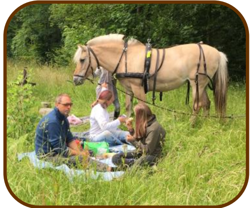
Familien Sørensen frokost i det grønne. Begge familier hedder Sørensen, og den ene familie har deres fjordhest Bellis i baggrunden.