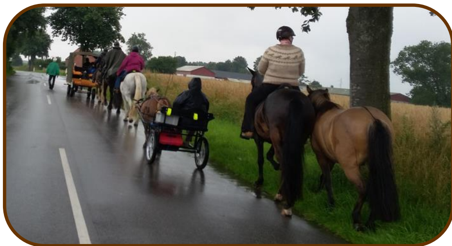
Kortege på vej til Hyggeweekend.

Da alle har sadlet op og spændt for kommer den anden halvdel af "feltet" fra Lone og Klaus sted, hvor de desværre ikke længere har foldene, som vi mødtes i sidste år. De kommer ind på marken, hvor vi venter, der laves en rækkefølge og afsted går det med 3 vogne, 7 ryttere, en løber og en håndhest... nemlig min islænder Omi. Jeg rider indimellem med dem som håndhest. Hvis det har regnet i mange dage, eller når der er sne på vejene, og begge trænger til at røres, så skridter vi ned til skoven og tager en omgang og så hjem igen.