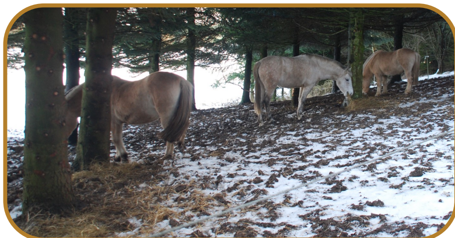
Donna, Aqua og Lillegut

Der hører et skovareal på 3.5 ha til vores landejendom. Vi nyder at kunne gå en lille tur i vores egen skov, hvor vi selv bestemmer, hvor tæt hesten må gå på rådyrenes fodertønder.