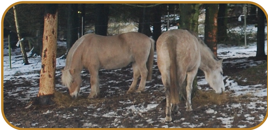
Lillegut og Aqua

Nu kommer jeg så til det afsnit, der handler om Vandalerne . Se lige nedenstående billede!