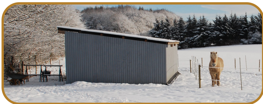
Løsdrifts stalden med god plads til 4 heste. Lillegut er gået ud og har stillet sig op til fotografering

På selve flyttedagen, som var den første søndag i oktober, ankom alle hestene med de meste af deres udstyr. Selv min maraton hestevogn var med på flyttedagen, imens der kun var pakket en enkelt weekendkuffert til os selv. Vi har heldigvis efterhånden fået den resterende vintergarderobe fragtet til Rønnede sammen med lidt møbler og div. køkkenting. Vi har nok boet lidt som på camping i de første par uger.