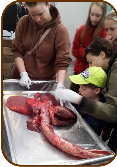
Inspektion af hestens indvolde

Vi har selv haft et føl/plag derinde da det lå i København. Da der ikke var mere at gøre for ham, fik de lov til at bruge ham til obduktion. De fandt aldrig ud af, hvad han fejlede.