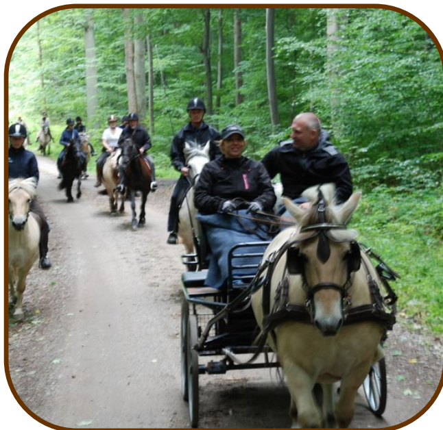
Turen til Kilden går gennem Store Bøgeskov

(Kører man efter Kraks Vejviser, kommer man ud på flere småveje fra modsatte side af skoven.)