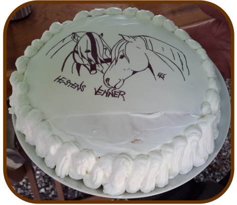
Lagkage med logo