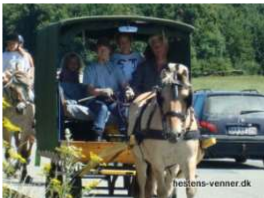
Deltagere på vej i vogn og på hest.