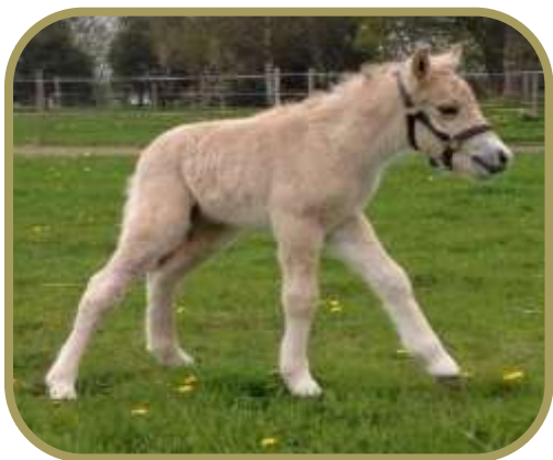
Gajol's første løbetur på fold

Jeg syntes, dommerne var meget hårde i år. Stort set alle fjordheste udstillerne var utilfredse, selv om de var kommet på fløjen. Dommerne plejer også altid at komme ned til staldene, så man kan diskutere deres bedømmelse, men vi så dem aldrig. Det blev kun til 21 points til min smukke Lotus. Det blev også kun til 21 point til Lilje, som ellers stod på fløjen både til følskue og 1 års plagskue.