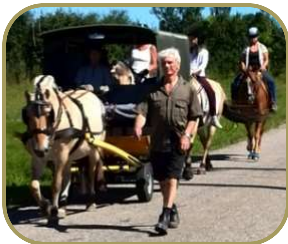
Kortege på vej til Hyggeweekend