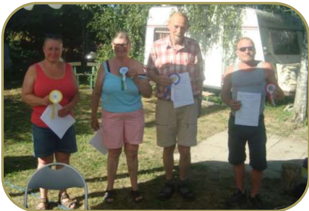
Deltagere i den trækkende agility klasse