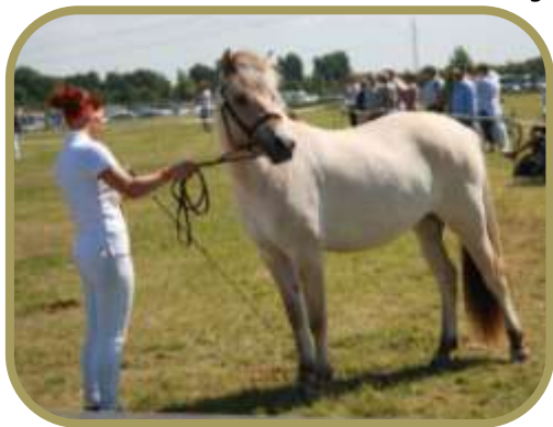
Line og Lilje