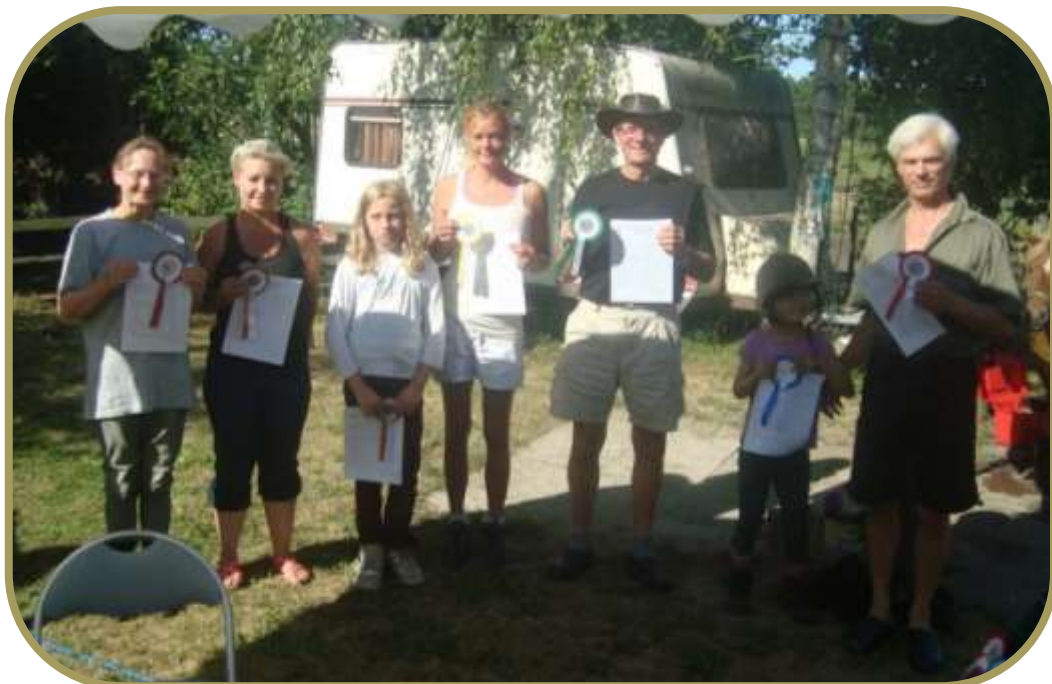
Deltagere i den ridende agilityklasse