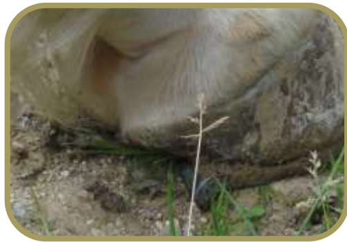
Billede af den specielle sko

Vi red på relative fine grusstier, men mange steder var der klippesten. Hestene var udstyret med specielle sko, hvor den bageste del af skoene var tilspidsede og nedad bøjedede for at kunne stå bedre fast.