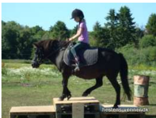
Anja på Stjerne, på vej over forhindring.