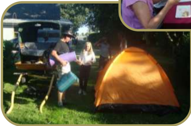
Telte og hestevogn bliver gjort soveklar