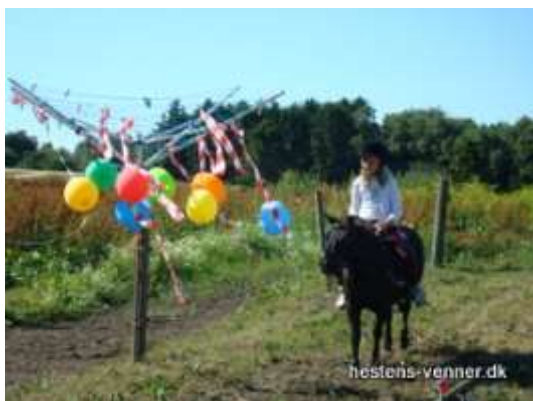
Camilla rider forbi tørrestativ på Stjerne