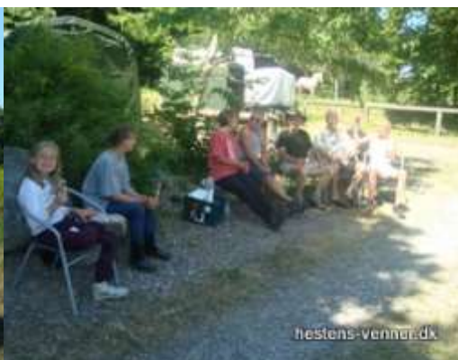
Lone gav is, efter veloverstået arrangement.