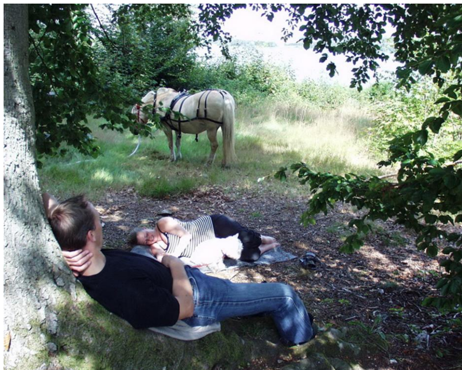
Ren afslapning i skoven.

Tilmeld hvad du/I har lyst og tid til at deltage i.