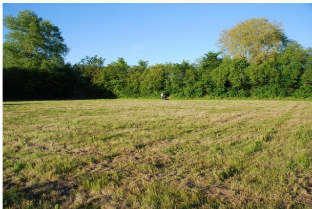
Der er tale om 2 baner. Den "lille" bane er faktisk også ret stor. På sidelinjen af denne "lille" bane står Inge Keldebæk.

Indbetaling skal ske til konto 9883-0000170043 mærket "Bane" samt indbetalers navn.