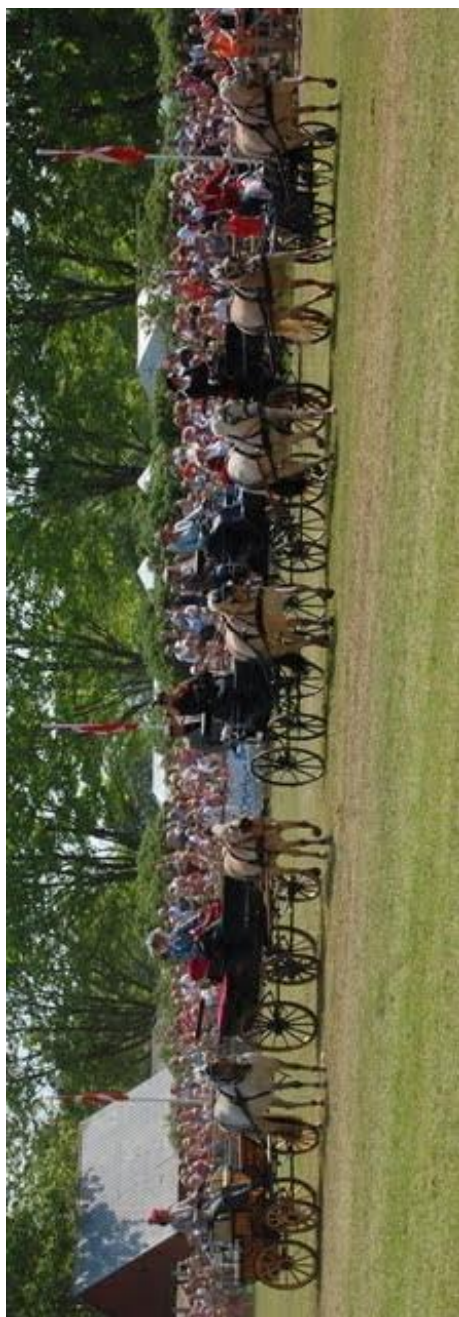
Der køres på linie og række