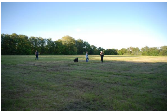
Dressurbanen opmåles og afsættes med ekstra hjælp fra hunden Ringo