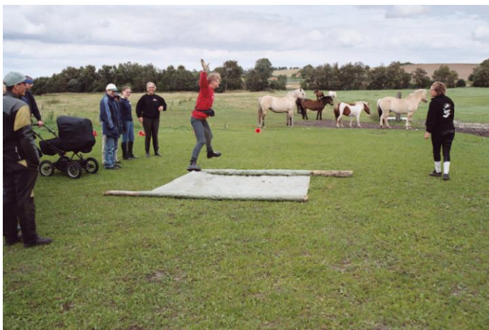
Banen afprøves af en tobenet deltager