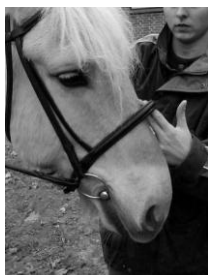
2 fingersbredder på højkant mellem næsebånd –og ryg.