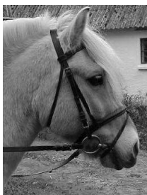
Achnæsebånd eller kombineret næsebånd.

Til alle jer, der vil være gode ved jeres hest, nægt at bruge ”instrumentet”. Husk, jeres hest er et levende væsen som kan føle ubehag og smerte – som os mennesker, forskellen er bare, at vi kan protestere, det kan hesten ikke. Lad os i fællesskab gøre alt for hele tiden at udføre et godt ”Horsemanship” – på rideskolerne, i klubberne og overalt hvor vi arbejder med heste.