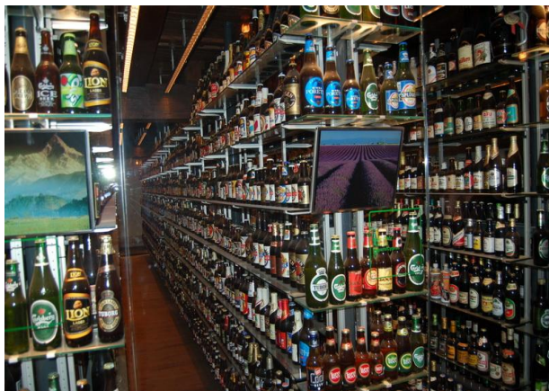
Et lille uddrag af flaskesamlingen

På en kold og blæsende dag mødtes vi ved porten til Carlsberg. Rundvisningen foregik på moderne vis uden guide. Turen var sat i nummerorden så man selv kunne gå rundt i eget tempo. Det første vi så var en kæmpe stor flaskesamling fra alverdens bryggerier. Der var flere tusinde. På væggen hang en tavle som de skrev på, hver gang en ny flaske ankom til samlingen. Det lignede faktisk et bibliotek bare med flasker i stedet for bøger.