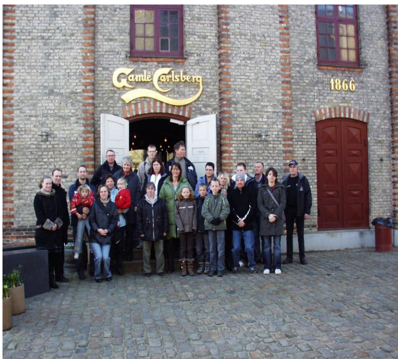
Her ses vi samlet foran indgangen til Carlsbergs besøgscenter