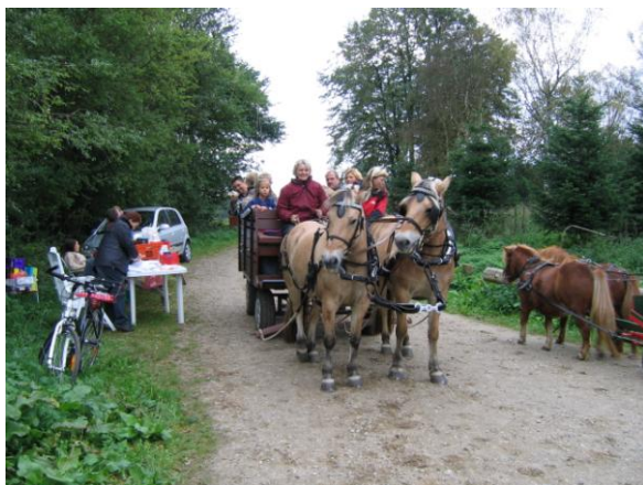
Her kommer der en ekvipage retur, efter en vellykket dag.