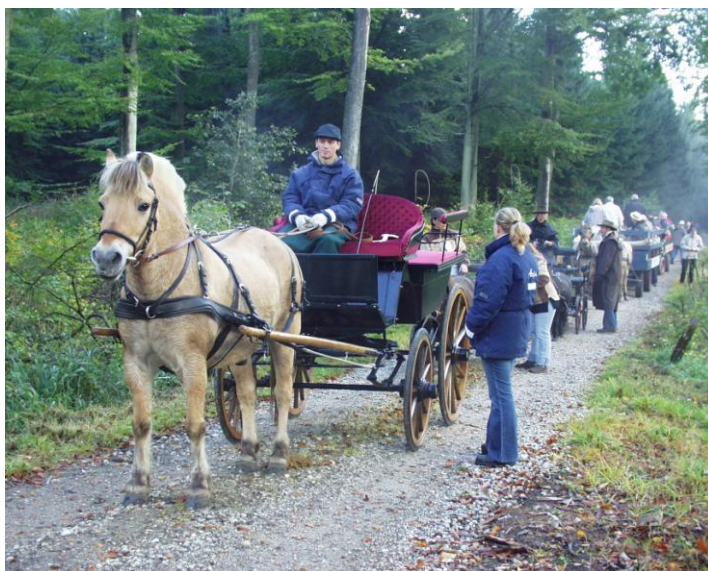
Billedet er fra skovturen i 2005.

Dansk Køreselskab har bestilt Ottestrup Forsamlingshus på selve dagen for efterårsskovturen. Her kan man bestille platter forud for dagen, men man kan også tage sin madkurv med. Drikkevarer skal købes i forsamlingshuset. Sidste år kostede en platte 75 kr. Husk at platter skal bestilles ca. en uge før.