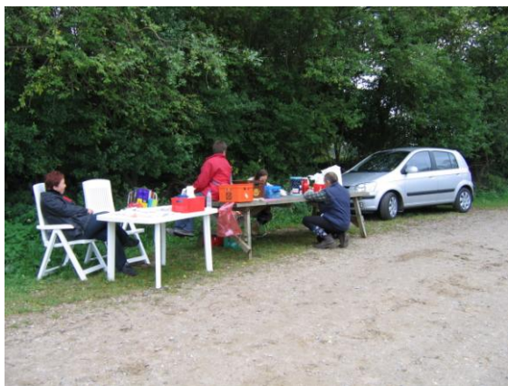
Sekretariatet får sig et velfortjent hvil.

På denne side kan ses et lille udpluk fra dagen, sidste år.