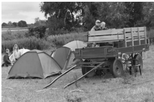
Fra noget af teltlejren 2005