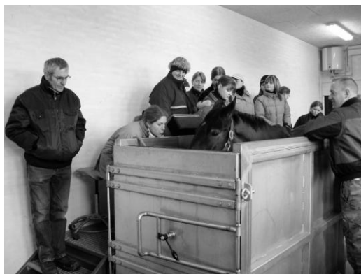
Hesten ses her i aquatræneren

Muskulaturens bevægelser og ryggens kurver kunne nøje følges. Den arbejdede nok et kvarter i vandet. Bagefter var der ikke skyggen af sved eller tegn på anstrengelse at spore.