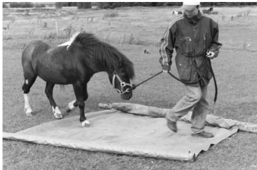
Rammstein på agilitybanen 2005

Vi glæder os til nogle hyggelige og sjove timer sammen med jer.