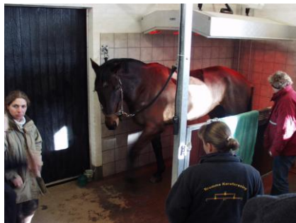
Heste solarium der kan indstilles i højden

Vi var alle sammen meget glade for at se alt dette med egne øjne. Denne aquatræner er svær at forklare om med ord. Det skal opleves. Mange heste ville have godt af en tur i ”karret”.