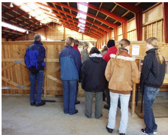
Fra ridehuset

Sandie har arbejdet i Tyskland. Der lærte hun noget om hvordan en ridehusbund skulle være. Et firma derfra har gravet ud og anlagt en sådan bund i ridehuset. Vi var meget imponerede. Man trådte ned og bunden fjedrede på en yderst behagelig måde. Luften derinde var også fri for støv.